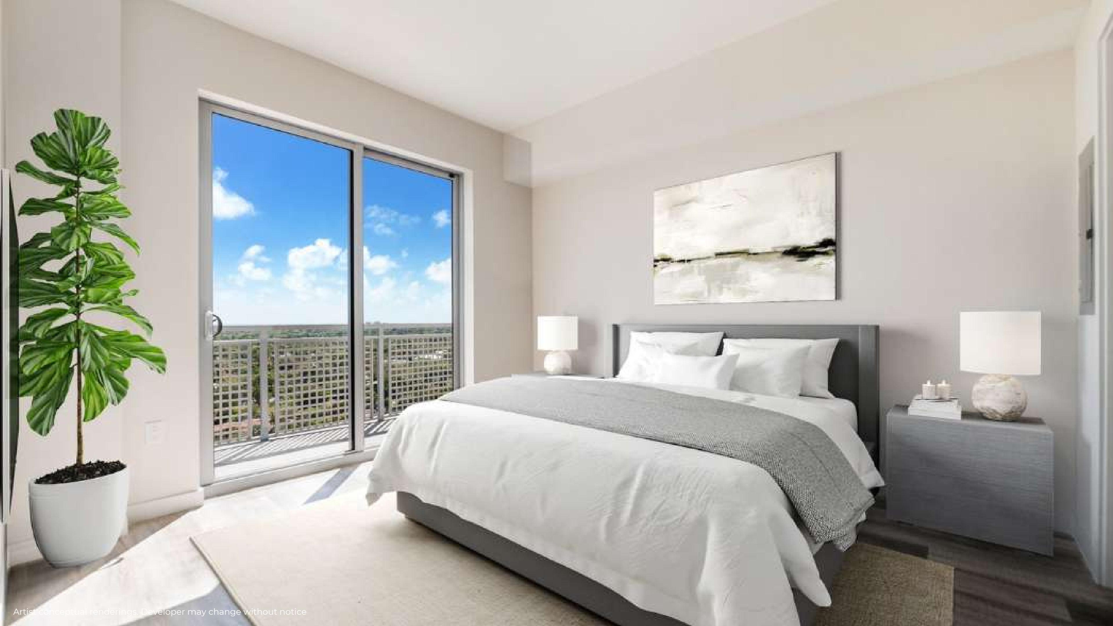
Artist conceptual renderings. Developer may change without notice