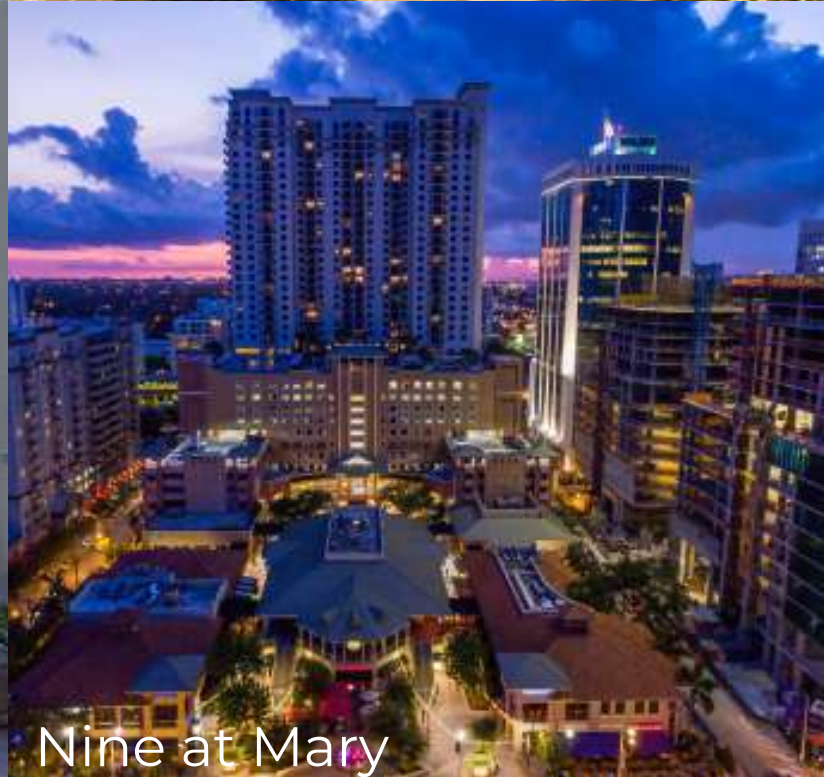
Nine at Mary