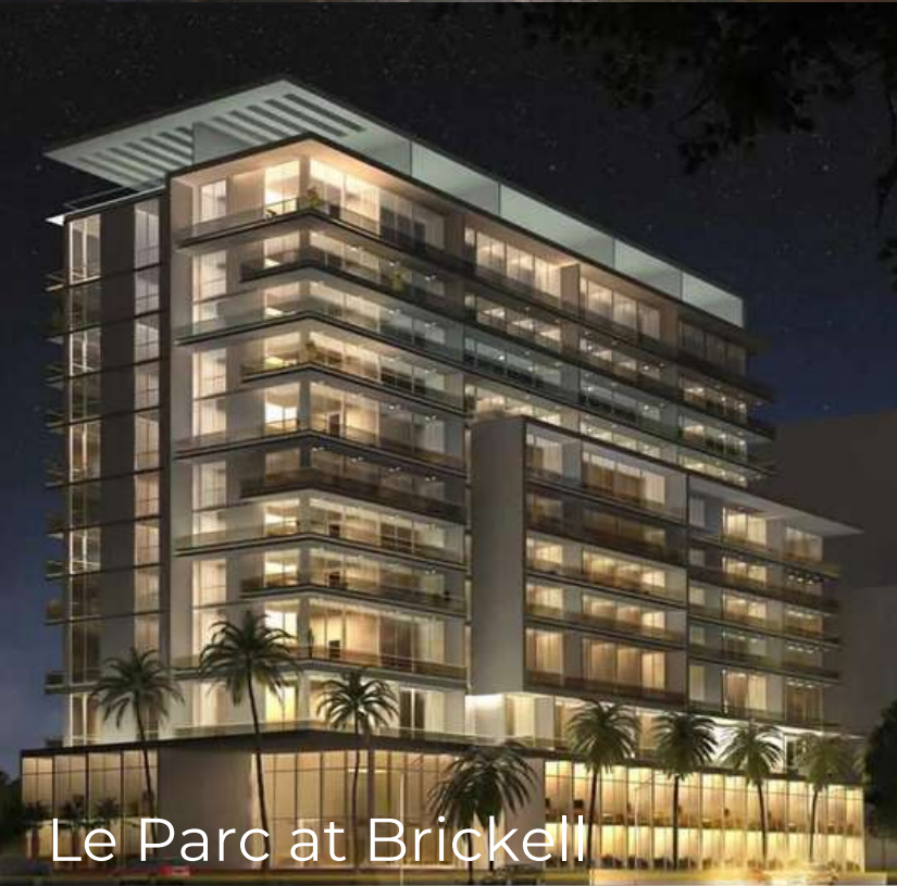
Le Parc at Brickell